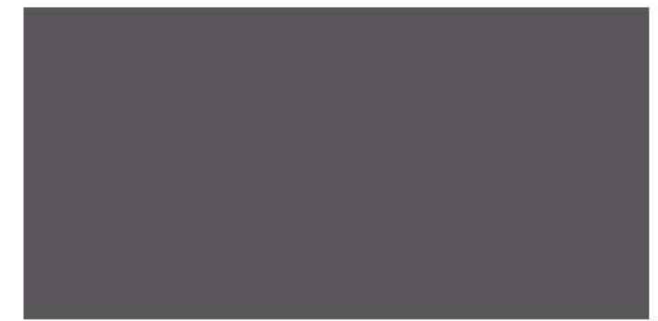
Granite Gray Gris Granite