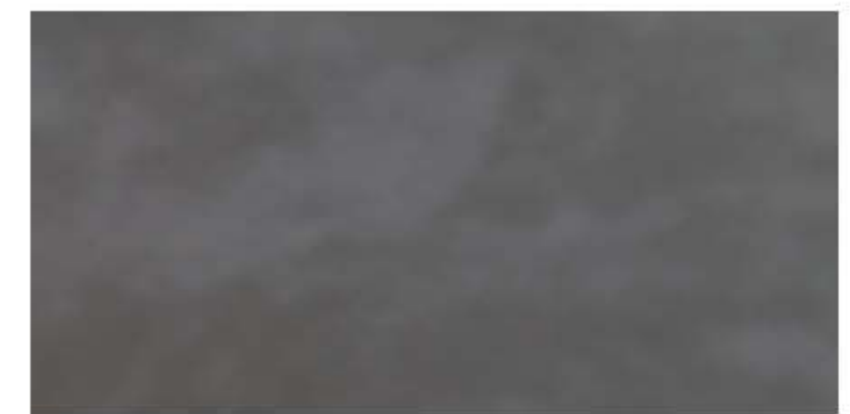
English Slate Ardoise Anglaise