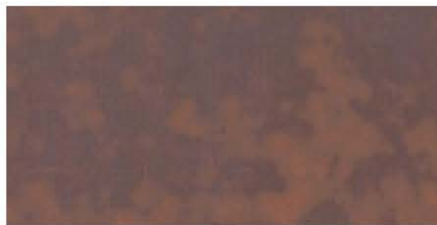
Adirondack Autumn Automne Adirondack